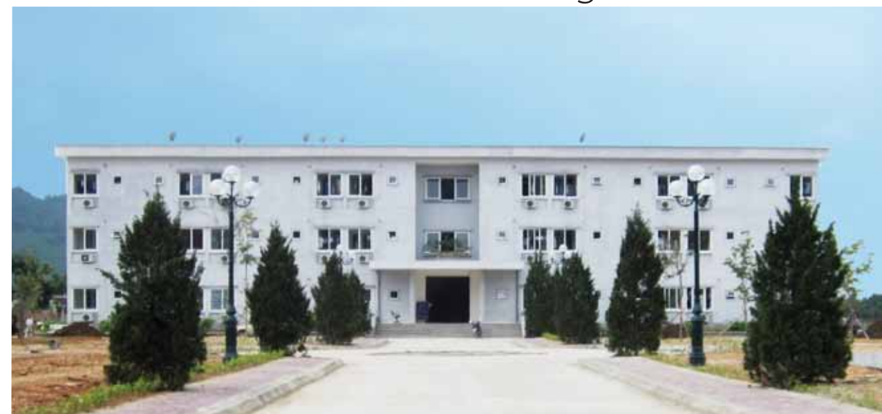
Tọa lạc trên mặt bằng của Công ty cổ phần giấy An Hòa, tòa nhà 3 tầng và khu văn phòng làm việc của nhân viên được xây dựng với tổng diện tích 13.750 m 2 (125x110m) nhằm đảm bảo cuộc sống ổn định để cán bộ yên tâm làm việc và công tác tốt. Sau một thời gian thi công, hiện nay tòa nhà 3 tầng đã hoàn thiện và đi vào sử dụng.

Công trình được khởi công xây dựng bắt đầu từ ngày 24/5/2011, đến nay khu chung cư cho CBNV đã hoàn thiện, khu văn phòng dự kiến sẽ hoàn thành vào tháng 8/2013. Nhà chung cư 3 tầng được đầu tư theo dự toán ban đầu với tổng giá trị khoảng 16,589 tỷ đồng, diện tích sử dụng là 2.661,75 m 2 . Khu văn phòng tổng giá trị khoảng 12,721 tỷ đồng, diện tích sử dụng là 2.071,4 m 2 , có khoảng 21 phòng chuyên biệt. Tòa nhà 3 tầng hiện có 56 phòng, trong đó có 8 phòng khách và 48 phòng thường, đáp ứng chỗ ở cho hơn 200 CBNV công ty. Phòng khách được trang bị bàn ghế và đầy đủ các vật dụng thiết yếu, tiện nghi, đảm bảo chỗ ăn ngủ cho các đoàn công tác lên thăm và làm việc tại Công ty. Đối với phòng